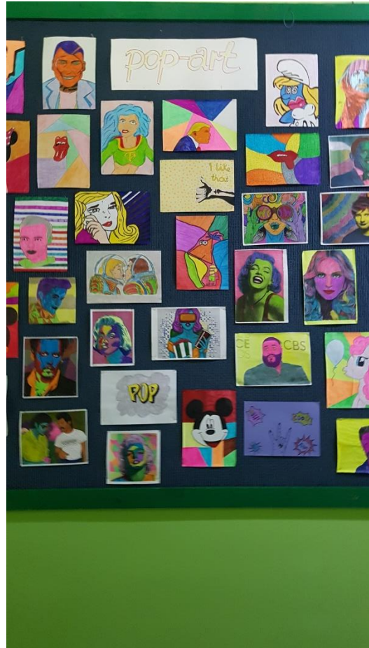
Mentorica: Jelka Flis